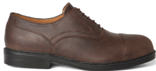
Oliver | 31769 | S3 Bruin | 1070 gram