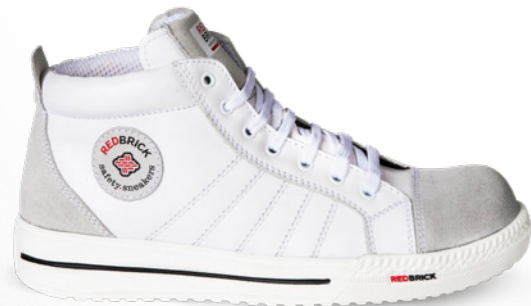
Mont Blanc | 31529 | S3 Wit | 1325 gram