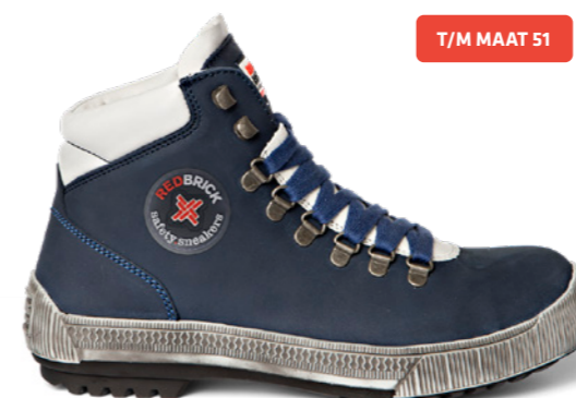
Smooth | 32303 | S3 Blauw | 1560 gram