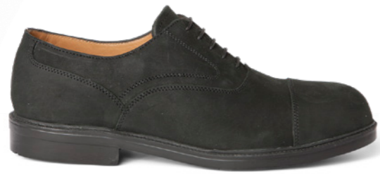
Harvey | 31770 | S3 Zwart | 1070 gram