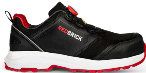
Pulse Speed Lace Low | 32325 | S3 Zwart/Rood | 1240 gram