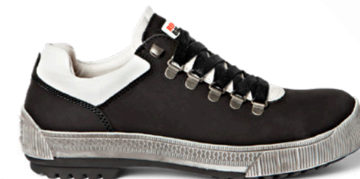
Fly | 32302 | S3 Zwart | 1450 gram