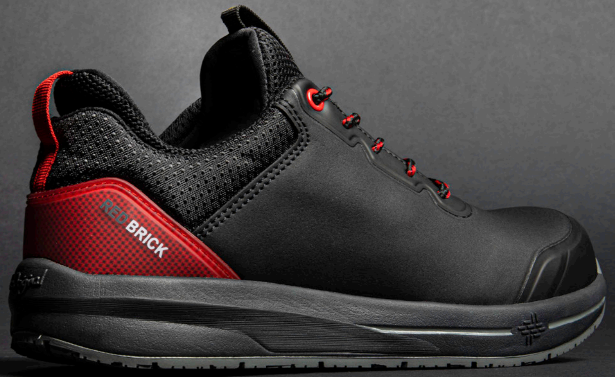
Fuse | 31335