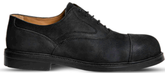
Harvey Metal Free* | 31771 | S3 Zwart | 1070 gram