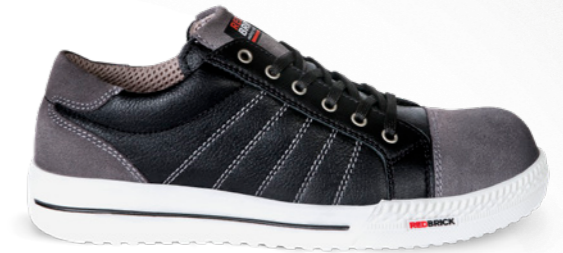
Slate | 31507 | S3 Zwart/Grijs | 1295 gram