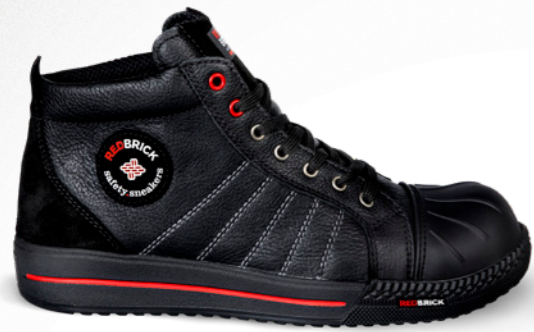
Onyx* | 31516 | S3 Zwart | 1330 gram