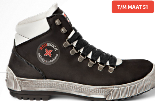
Jumper | 32301 | S3 Zwart | 1560 gram