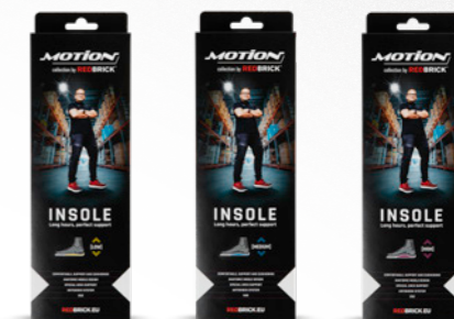
LOW MEDIUM HIGH