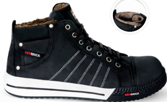
Ice | 31535 | S3 Zwart | 1295 gram