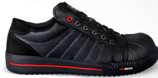
Ruby* | 31515 | S3 Zwart | 1315 gram