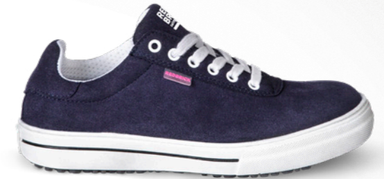
Lorna | 31366 | S3 Blauw | 890 gram