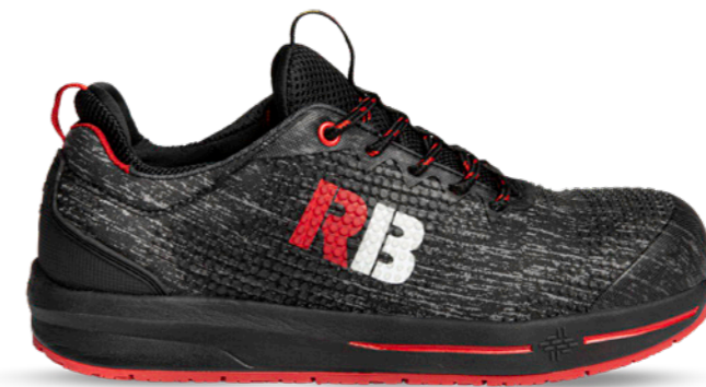
Comet 2.0s | 31354 | S3 Antraciet | 995 gram