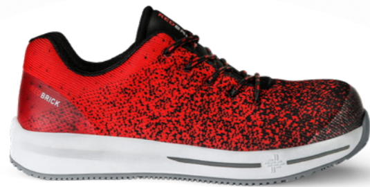
Spirit | 31340 | S1P Rood | 995 gram