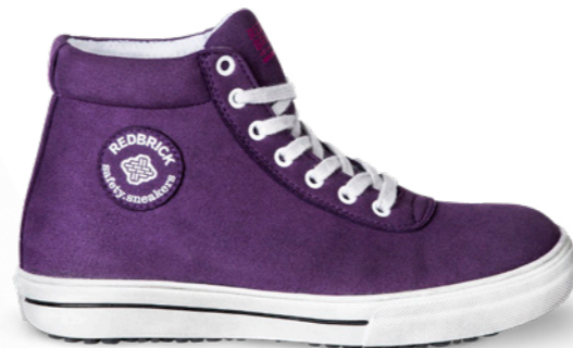
Louise | 31365 | S3 Paars | 950 gram