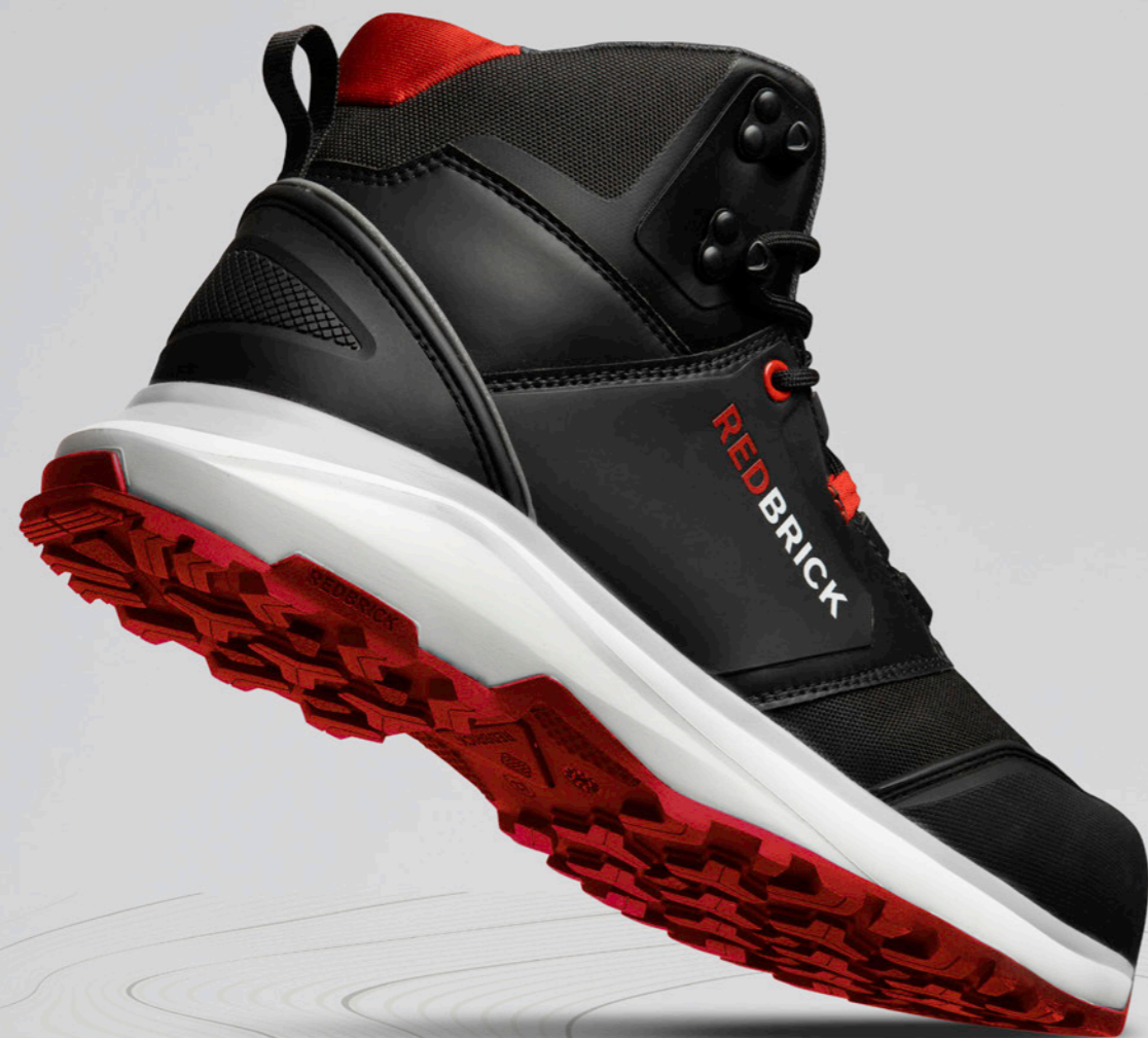
Pulse High | 32321

Maak kennis met de Redbrick Pulse. Deze collectie bestaat uit verschillende modellen. Van een regular versie tot één met snelsluiting, een waterproof schoen en één met extra verstevigde overneus. Strak design en ideaal als je op de werkvloer tegen een stootje moet kunnen. Want soms wordt daar net wat grover geschut ingezet. Eigenlijk net als bij de humor met je maten die de ene keer steviger is dan de andere. En over grote maten gesproken: Pulse is verkrijgbaar tot en met maatje 51.