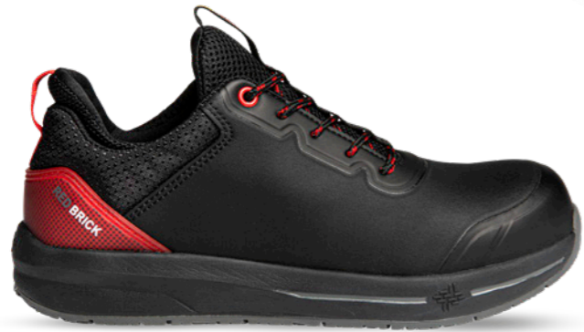
Fuse | 31335 | S3 Zwart/Rood | 1020 gram