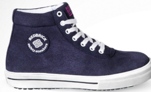
Lisa | 31362 | S3 Blauw | 950 gram