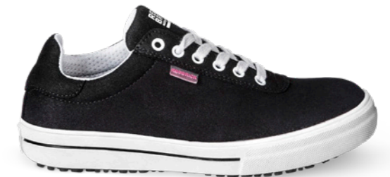
Lena | 31368 | S3 Zwart | 890 gram