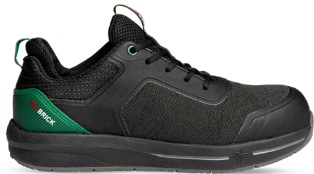
Force | 31336 | S3 Zwart/Groen | 1060 gram