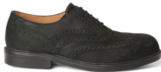
David | 31768 | S3 Zwart | 1070 gram