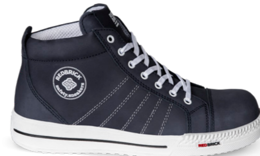
Azure | 31534 | S3 Blauw | 1325 gram