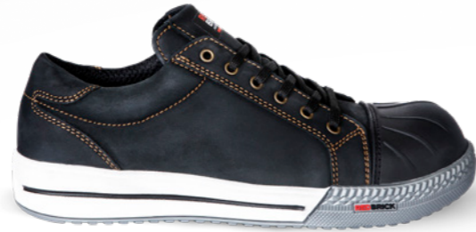
Flint | 31503 | S3 Zwart | 1315 gram