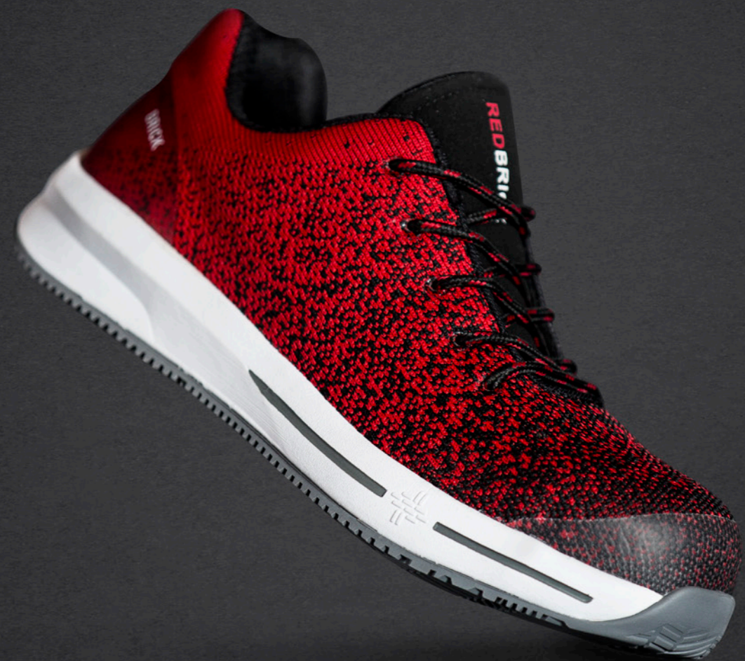
Spirit | 31340