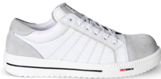
Branco | 31530 | S3 Wit | 1295 gram