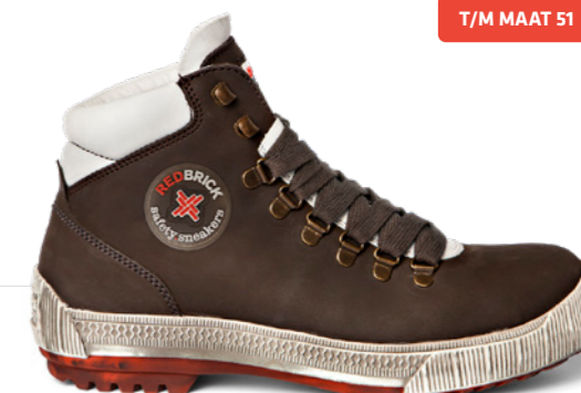
Freestyle | 32305 | S3 Bruin | 1560 gram