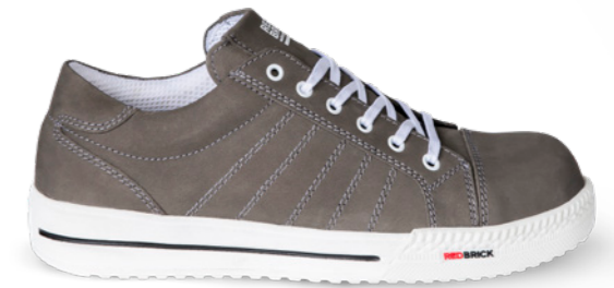
Druse | 31531 | S3 Taupe | 1295 gram