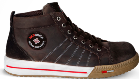
Smaragd | 31512 | S3 Bruin | 1325 gram