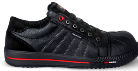
Ruby Hydratec | 31536 | S3 Zwart | 1345 gram