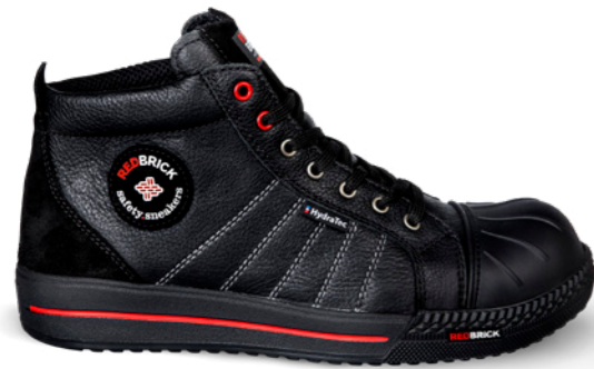
Onyx Hydratec | 31537 | S3 Zwart | 1360 gram