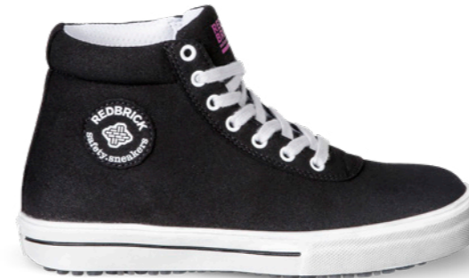
Linda | 31364 | S3 Zwart | 950 gram