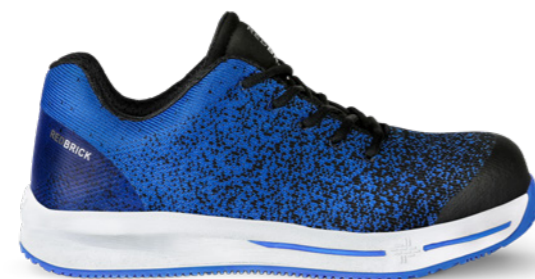
Infinity | 31342 | S1P Blauw | 995 gram