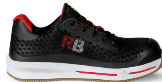
Sierra | 31346 | S1P Zwart/Rood | 1050 gram