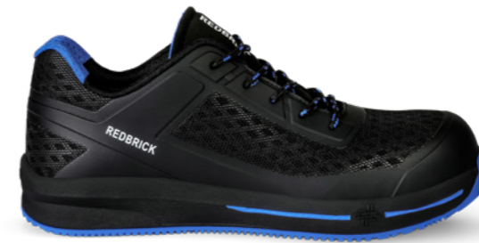
Star | 31345 | S1P Zwart/Blauw | 1050 gram