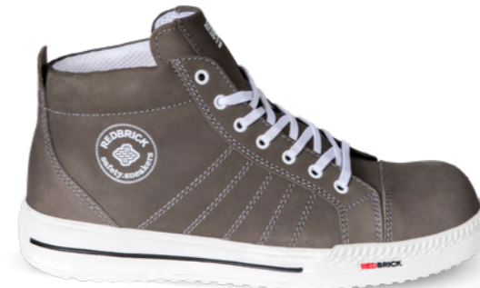
Jesper | 31532 | S3 Taupe | 1325 gram