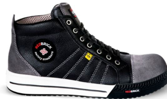
Granite ESD | 31539 | S3 Zwart/Grijs | 1325 gram