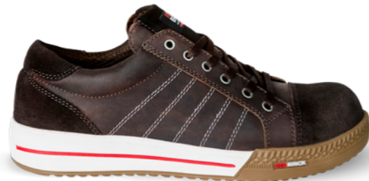
Emerald | 31511 | S3 Bruin | 1295 gram