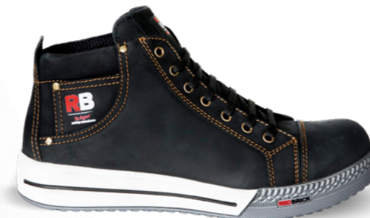
Gold* | 31502 | S3 Zwart | 1325 gram