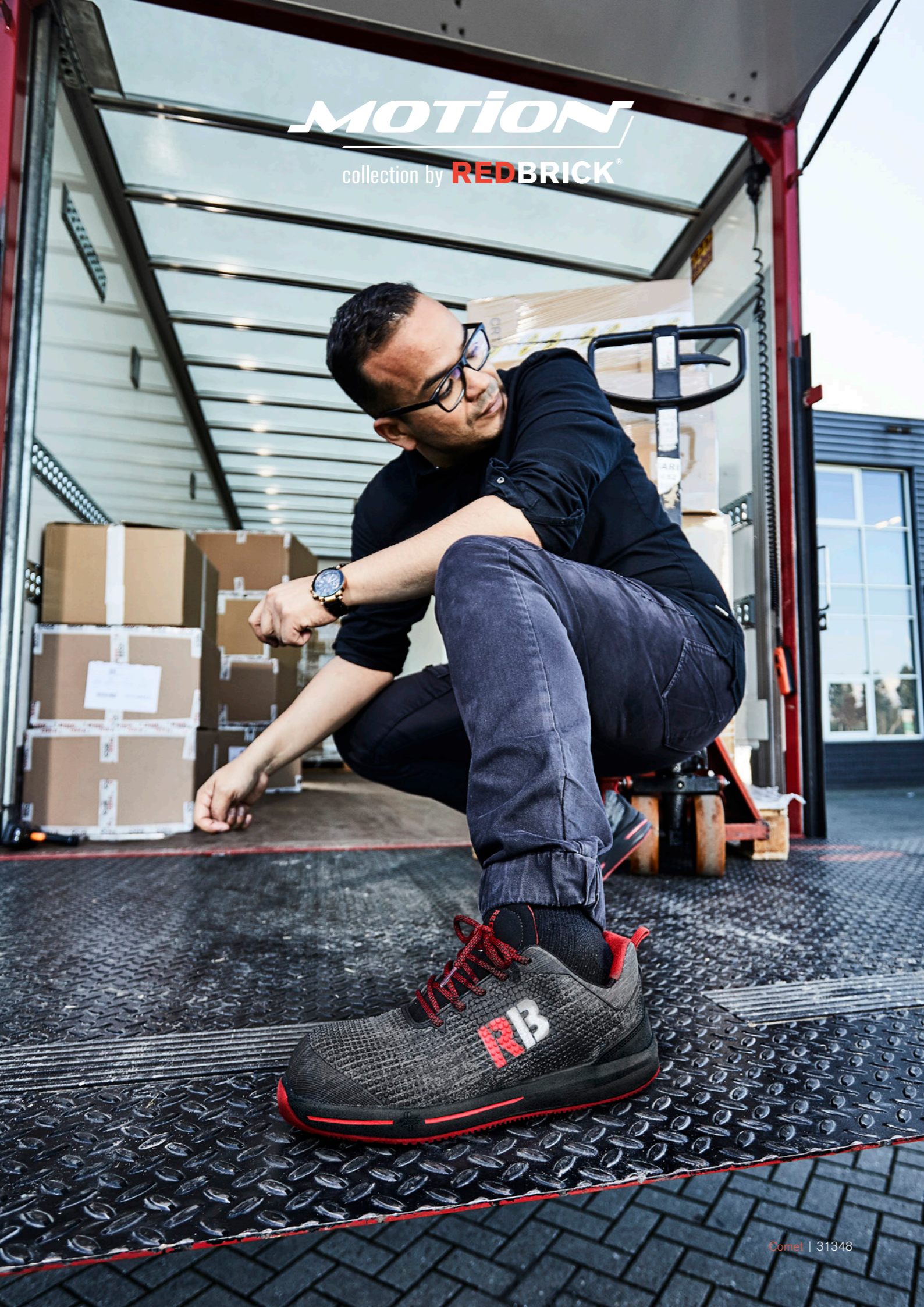
Comet | 31348