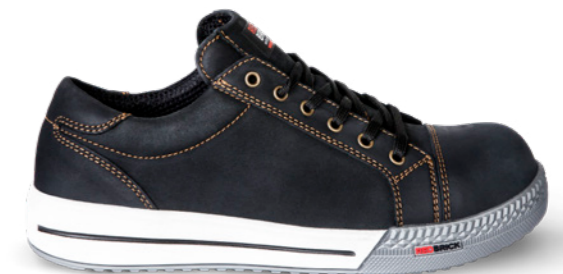
Bronze | 31505 | S3 Zwart | 1295 gram