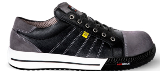
Slate ESD | 31538 | S3 Zwart/Grijs | 1325 gram