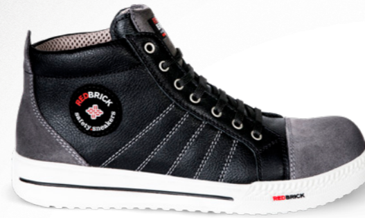
Granite* | 31508 | S3 Zwart/Grijs | 1325 gram