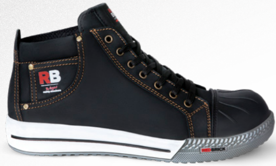
Sunstone | 31504 | S3 Zwart | 1330 gram