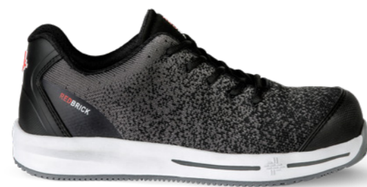
Agile | 31343 | S1P Grijs | 995 gram