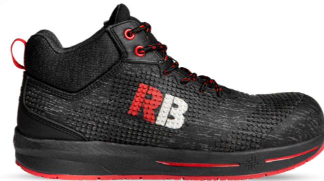
Comet High | 31352 | S3 Antraciet | 1040 gram