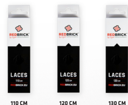
110 CM 120 CM 130 CM