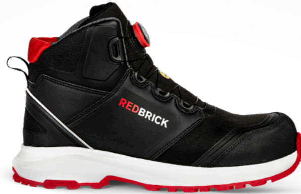
Pulse Speed Lace High | 32326 | S3 Zwart/Rood | 1320 gram