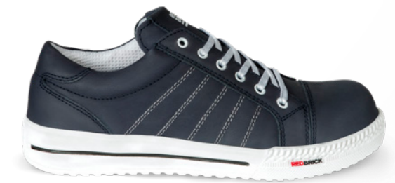
Saphire | 31533 | S3 Blauw | 1295 gram